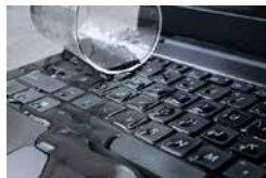
水濡れしたノート PC