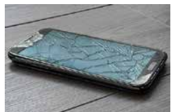
落下による画面割れ