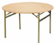
01 ベニヤ丸テーブル 1200