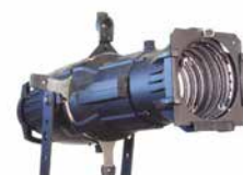
16 スポットライト CSPOT36

●ベルトサイズ：L 2,000 ●色：赤のみ ※最低 2本以上でご利用になります。