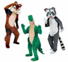
32 コスプレ、着ぐるみ各種

※色・サイズは各種ございます。筆耕も承ります。 ※内容、料金についてはお問い合わせください。