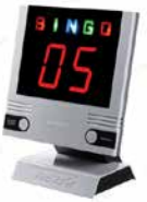
25 ビンゴゲーム (デジタルビンゴマシン)