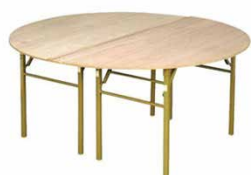
02 ベニヤ丸テーブル 1500