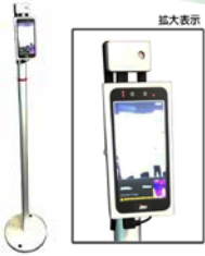
17 非接触検温機 SenseThunder-Mini(JCV)