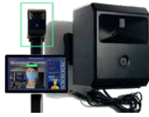
18 AIサーモグラフィカメラ DC-77

●コンパクトで高精度:5.5インチのコンパクトサイズで±0.4°Cの精度で体温測定 ●非接触・ウォークスルー:0.5~1.2mの距離でマスクを着用したままでも0.5秒以内に体温を検知