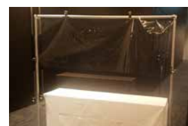
08 受付用 飛沫防止シート

●材質：アクリル樹脂版 ●飛沫防止アクリルスタンド、アクリルボード連結用土台円柱(溝3mm)と組み合わせてご使用ください。