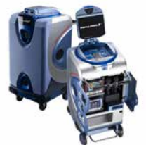
24 通信カラオケセット