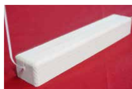
07 アクリルボード連結用土台 垂木(溝3mm)

●材質：アクリル樹脂版 ●飛沫防止アクリルスタンド、アクリルボード連結用土台垂木(溝3mm)と組み合わせてご使用ください。 ●4つ切り/6つ切り対応