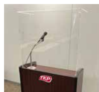
10 演台用 アクリルボード

●サイズ：W900 × D350 × H1,797 ●重量：約 8.2kg ●材質：透明アクリル樹脂(板面)、アルミ(フレーム) ●キャスター付き