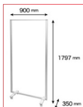
09 C付透明アクリルパーティションVV

●サイズ：W1,800×H1,800(スタンド)、W1,800×H900(シート) ●材質：軟質塩化ビニール(シート) ●セット内容：透明シート1枚/ポール3本/ベース2個/連結用金具2個/目玉クリップ5個