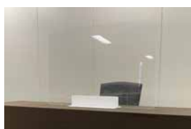
05 飛沫防止 アクリルスタンド

●サイズ、柄、色等ご希望に合わせてご用意いたします。内容、料金についてはお問い合わせください。