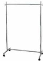
26 スライドハンガー

●サイズ:H300×W240 ●ビンゴカード別途販売 50枚1組 300円(税別)