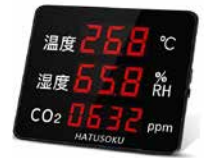
28 CO2濃度測定器 HSK-2012-01