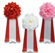
31 胸章 大・中・小 販売商品