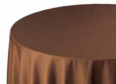
04 テーブルクロス 各種