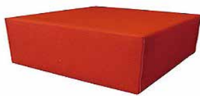
30 酒樽台(鏡割台) 750角 H350 キャスター付

●セット内容:樽本体(4斗樽1・祝)、ステンレス桶、木蓋・木槌5・柄杓2 ●酒樽サイズ:φ550×H570 ●※お酒、升は含まれておりません。